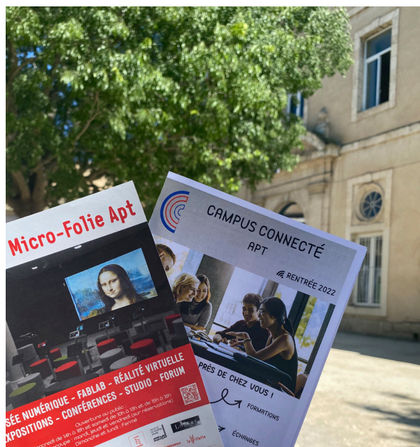
Les Romarins

Visitez et profitez dès à présent des différents modules de la Micro-Folie d'Apt qui propose aussi un programme d'éducation artistique et culturelle auprès des groupes scolaires (écoles, collèges et lycées) du Pays-d'Apt.