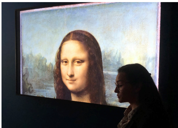
Mme Beridot, La Villette - Musée numérique

Le musée numérique permet d'approcher au plus près les grandes œuvres des Institutions nationales grâce à une numérisation en très haute définition!