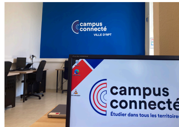
Campus connecté

Des temps sportifs : randonnées et accès gratuit à certaines infrastructures municipales.