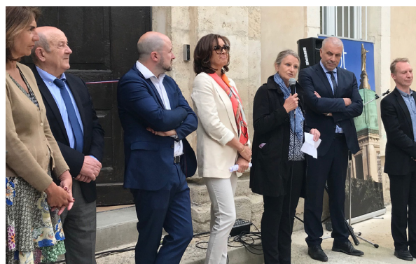
Inauguration des Romarins