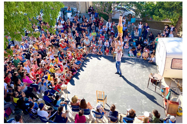
La Cour des Folies d'Apt

L'artiste avignonnais Clément Puig effectue des collages de portrait photo en noir et blanc sur de très grandes surfaces. Le regard pétillant d'un enfant est visible sur la façade du Musée Numérique.