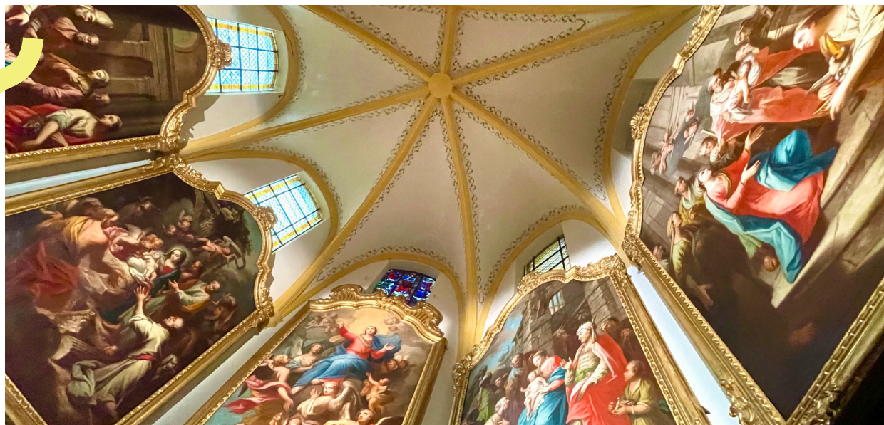
Tableaux du chœur de la cathédrale

Émerveillez-vous lors de la déambulation lumineuse proposée par «Congo Massa» et «Electro Frogs» illuminant la Ville de mille couleurs. Le 4 Juin à 21h30