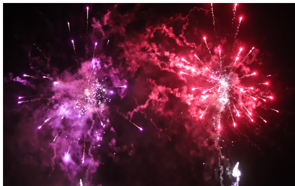
Feu d'artifice

Le 6 juin à 22h15, Cours Lauze de Perret