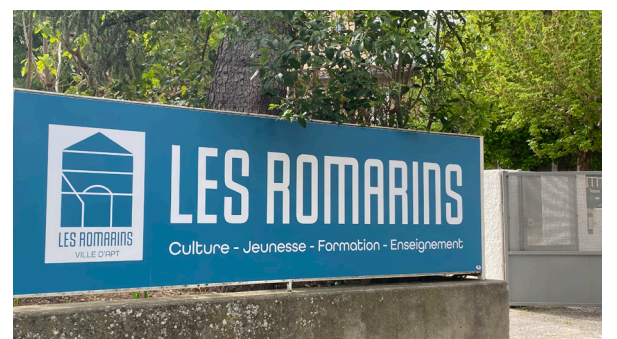
Les Romarins

Vernissage le 8 juillet dès 19h00. >>> Exposition visible jusqu'au 29 août 2022