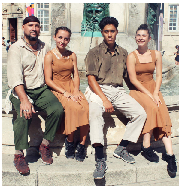
Danseurs (© Compagnie Evolve)

Le 4 et 5 juin à 17h30 sur la Place Carnot.