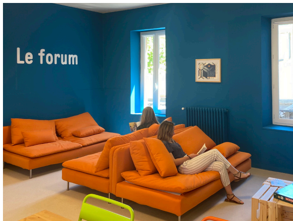
Le Forum

Cet espace ludique et convivial est mis librement à disposition de tous.