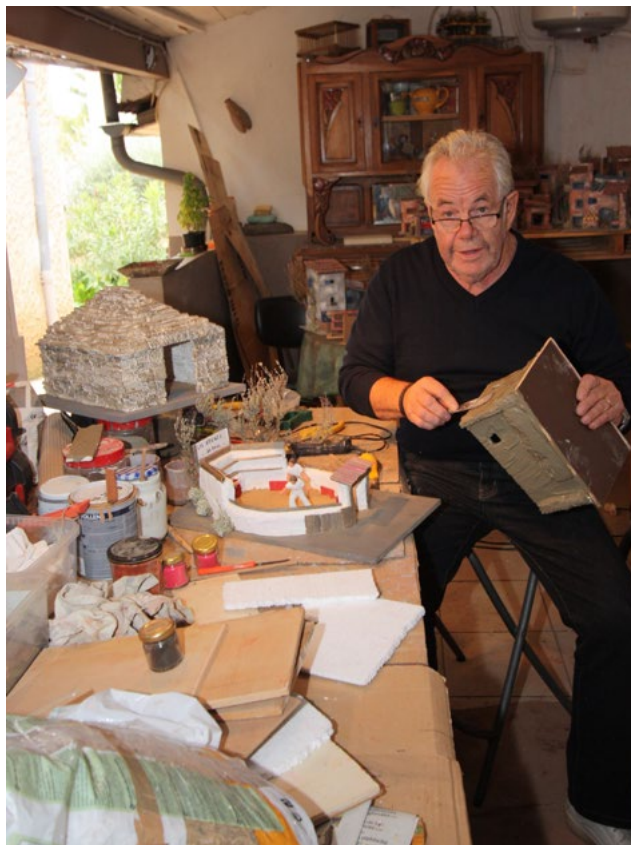
Le salon des santonniers aura lieu dans les anciens locaux de l'office de tourisme, avenue Philippe Girard du 15 au 30 décembre. De 9h à 12h et de 14h à 18h.

La crèche est un régal de la tradition. Elle relève du savoir-faire de chacun, sa mise en scène s'enrichit au fil du temps, ses sempiternels acteurs se transmettent de génération en génération. Mais où aller crécher ? « Il y a celle de la Cathédrale, bien sûr. Et si on veut faire une jolie ballade, se rendre à Castellet où les habitants – une centaine – font une trentaine de crèches, sur les pas des portes, suspendues aux fenêtres ou nichées au creux d'un mur. On peut prendre la direction de Saint-Saturnin pour voir la crèche exceptionnelle par ses dimensions et la centaine de grands santons dont la moitié est animé de mouvement. Aller à l'église romane de Bonnioux abritant des santons centenaires et des santons napolitains. Et puis découvrir à Villars, une crèche avec des personnages vivants. » D'où l'expression, « faire le santon », désignant ceux qui baillent aux corneilles.