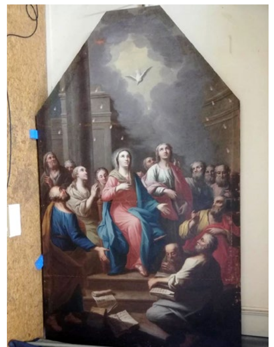
Tableau 'Pentecôte' en cours de restauration.

Ce document d'orientation stratégique définit la vocation du musée et son développement pour les années à venir. Après une première partie de bilan de l'existant, il présentera le projet de réaménagement du musée municipal, visant à regrouper l'ensemble des collections au sein d'un parcours muséographique et d'espaces de réserves rationalisés.