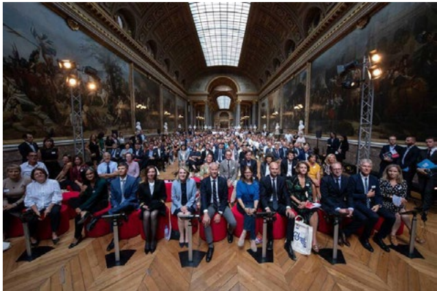
Le Ministère de la culture réunissait le 16 septembre à Versailles 200 élus locaux.

Il se construit, dans chaque commune qui souhaite créer le sien, avec la collaboration de douze des plus grands établissements culturels nationaux dont le Louvre, le château de Versailles, le Centre Pompidou, la Villette et, plus proche de nous, le festival d'Avignon.